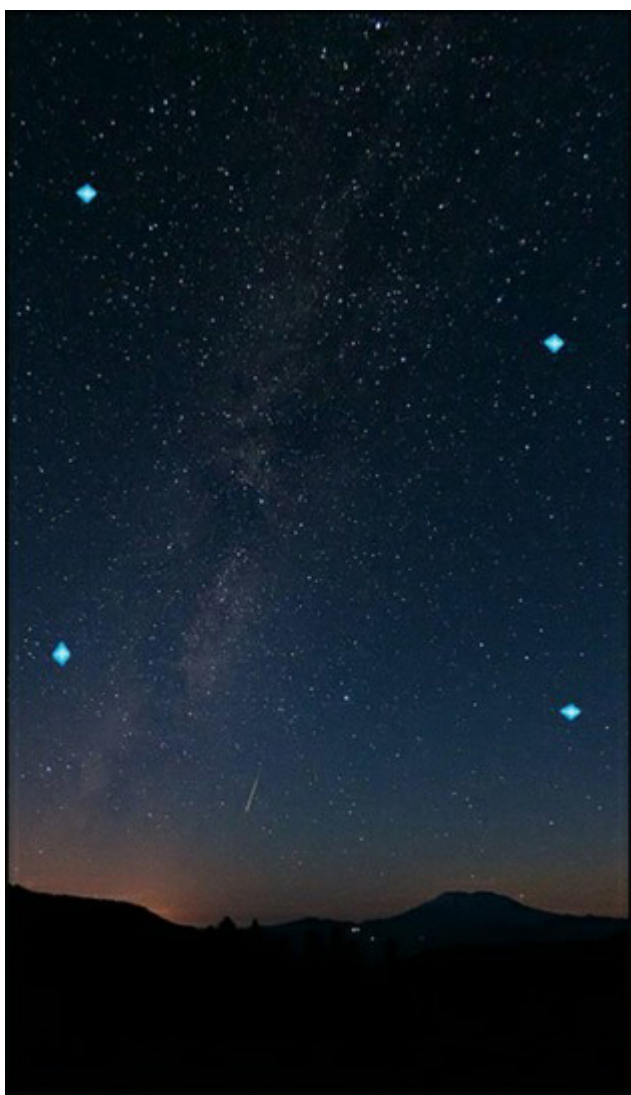
Fotografías del video

sentíamos la boca seca. Nos pareció curioso y seguimos armando nuestro campamento, preparando el equipo de visión nocturna, el telescopio y demás equipos, todo funcionaba bien.