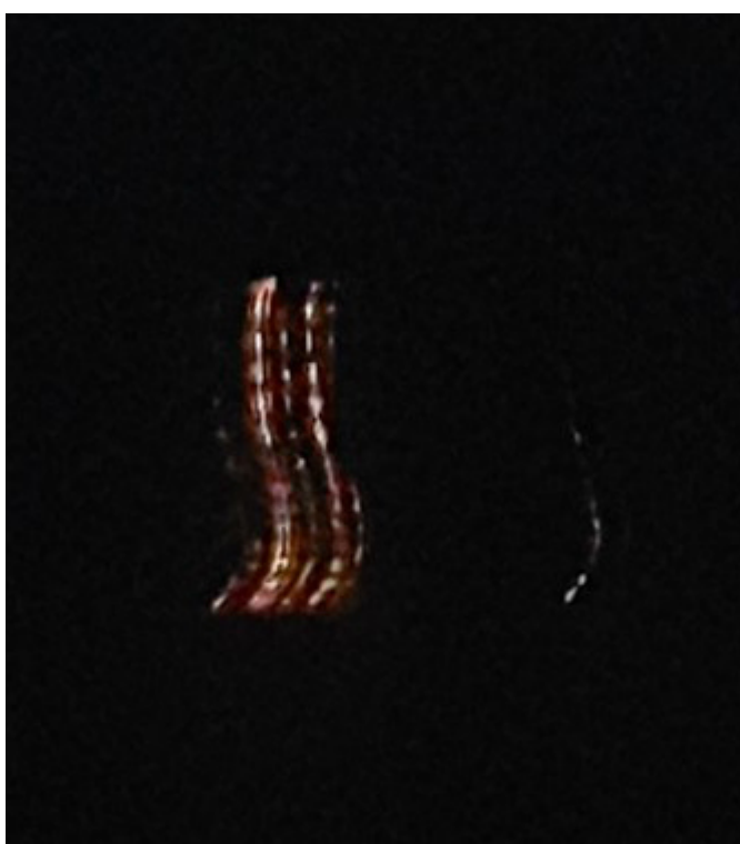
Fotografía tomada del celular

se pudo grabar, advertimos que aparte de las luces que se visualizan, se escucha una voz, que no pertenece a nadie del grupo, esta voz dice " ESPEREMOS ". Podríamos especular que esta voz corresponde a uno de los ocupantes de esas luces, ¿Iban a esperar que se fueran los aviones? o ¡Iban a esperar a que nos durmiéramos!.